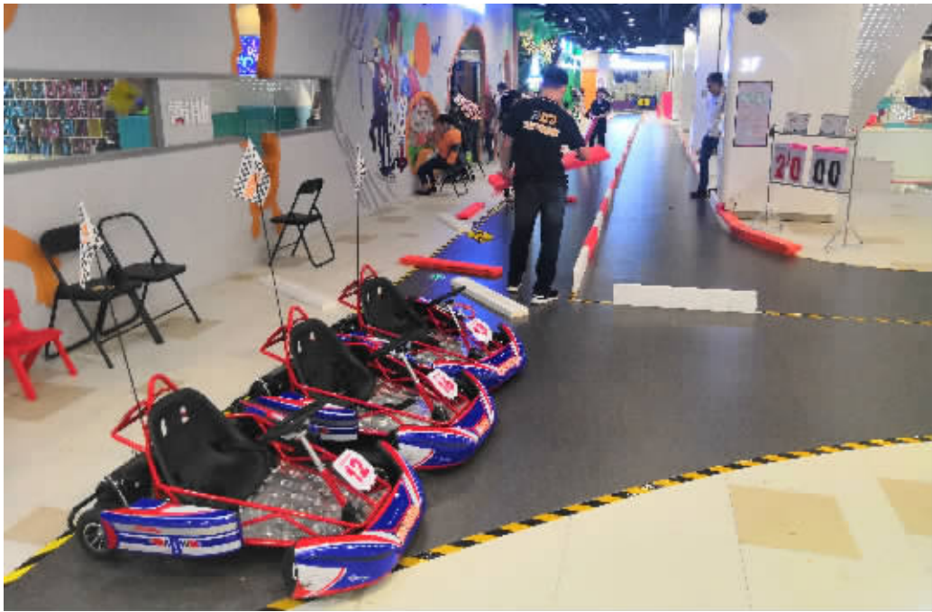
卡丁车游玩跑道占据了商场疏散通道的过半面积